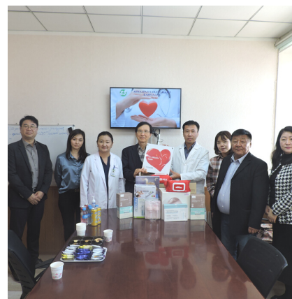
Төв аймгийн Нэгдсэн эмнэлэгт Эх нярайн өрөөнд зориулан зарим шаардлагатай тоног төхөөрөмж, аппарат хэрэгслийг гардууллаа

Монголын Гэр бүлийн сайн сайхны нийгэмлэг, БНСУ-ын Хүн амын эрүүл мэнд, нийгмийн хамгааллын нийгэмлэг хоорондын хамтын ажиллагааны хүрээнд Төв аймгийн Нэгдсэн эмнэлэгт Эх нярайн өрөөнд зориулан зарим шаардлагатай тоног төхөөрөмж, аппарат хэрэгслийг гардууллаа.