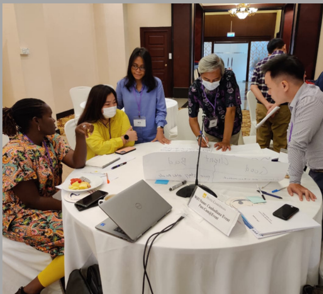
Камбож улсад болсон "Үйлчлүүлэгч төвтэй чанартай тусламж үйлчилгээний үнэлгээний семинарын үеэр, 2022.10-р сар