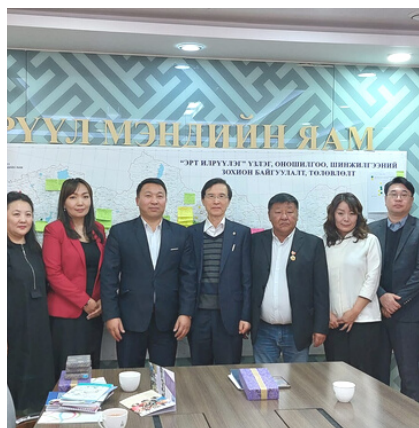
ЭМЯ-ны холбогдох удирдлагуудтай уулзалт хийж, хамтран ажиллахаар тохиролцов.