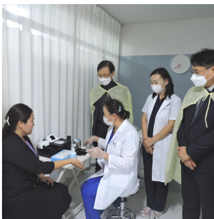
Солонгосын төлөөлөгчид Гэр бүл эмэгтэйчүүдийн эмнэлгийн үйл ажиллагаатай танилцав.