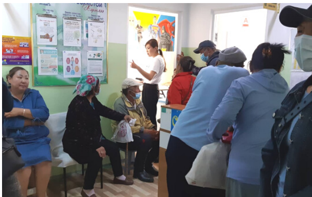
Өмнөговь Цогт-Овоо сумын иргэд

Явуулын үзлэг: Орон нутгийн Эрүүл мэндийн газар, Нэгдсэн эмнэлэг болон өрх, хувийн хэвшлийн эрүүл мэндийн байгууллагуудтай хамтран найман салбар явуулын тусламж үйлчилгээг хэрэгжүүллээ. Нийт найман аймгийн 20 389 хүнд 30 нэр төрлийн тусламж үйлчилгээг үзүүлэхэд дэмжлэг үзүүлж ажиллаа.